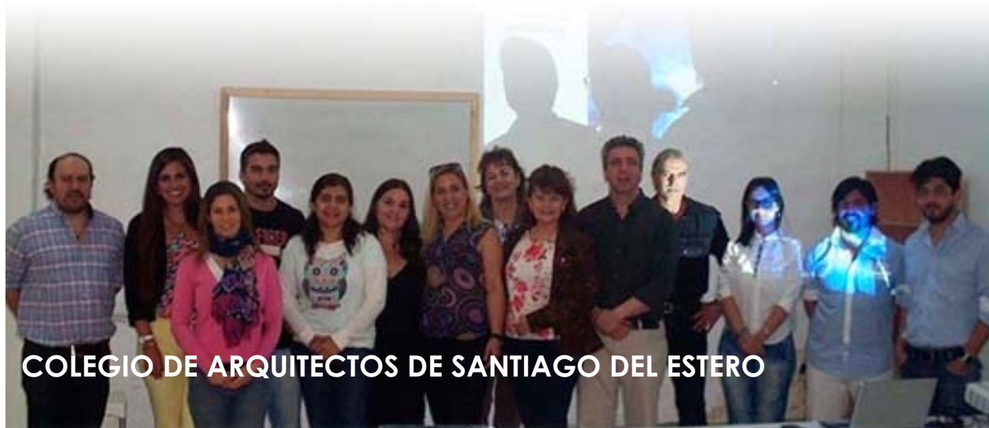
COLEGIO DE ARQUITECTOS DE SANTIAGO DEL ESTERO

Un gran compromiso por la Formación Profesional