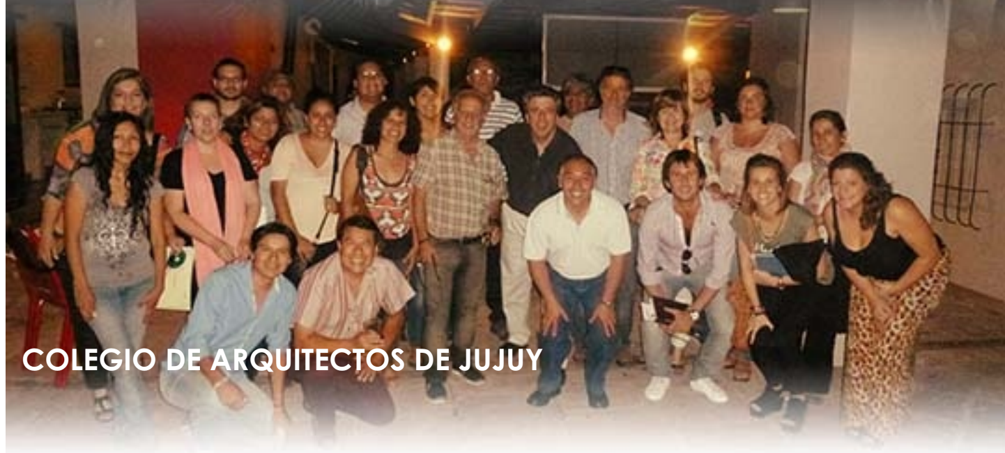
COLEGIO DE ARQUITECTOS DE JUJUY