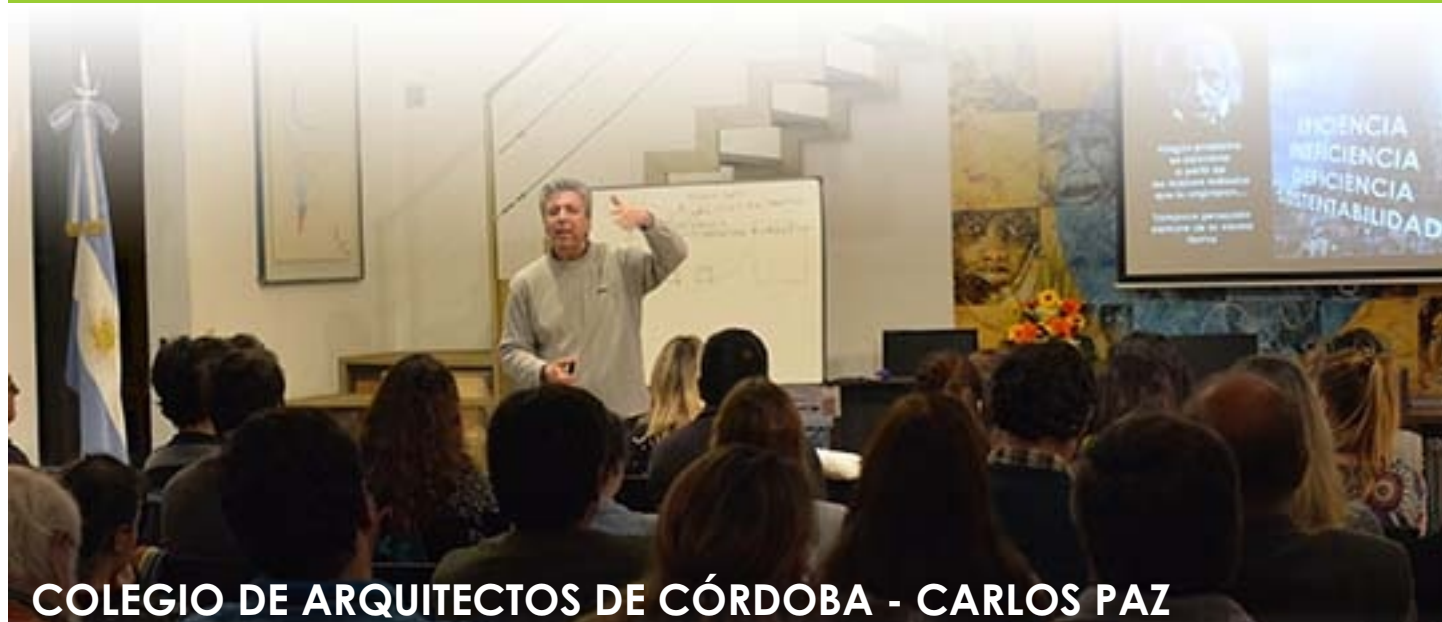
COLEGIO DE ARQUITECTOS DE CÓRDOBA - CARLOS PAZ

Un gran compromiso por la Formación Profesional