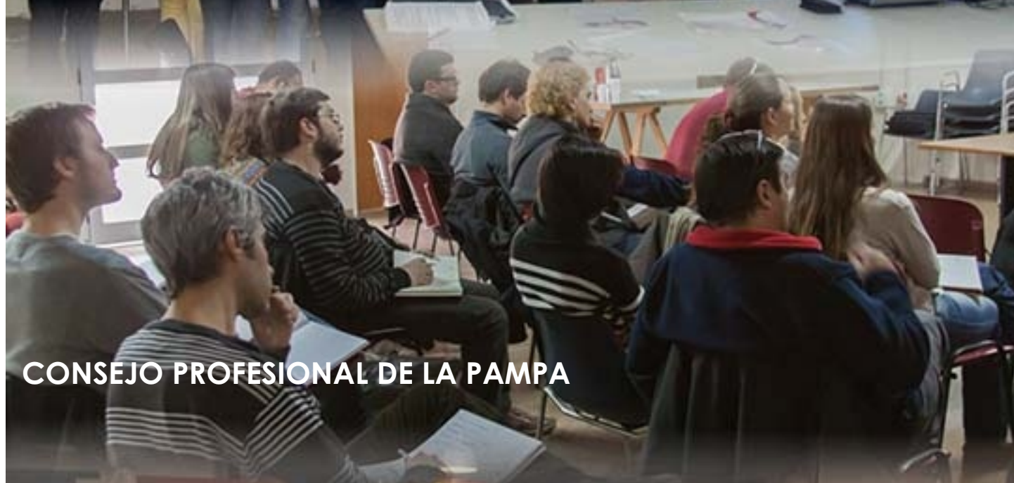
CONSEJO PROFESIONAL DE LA PAMPA