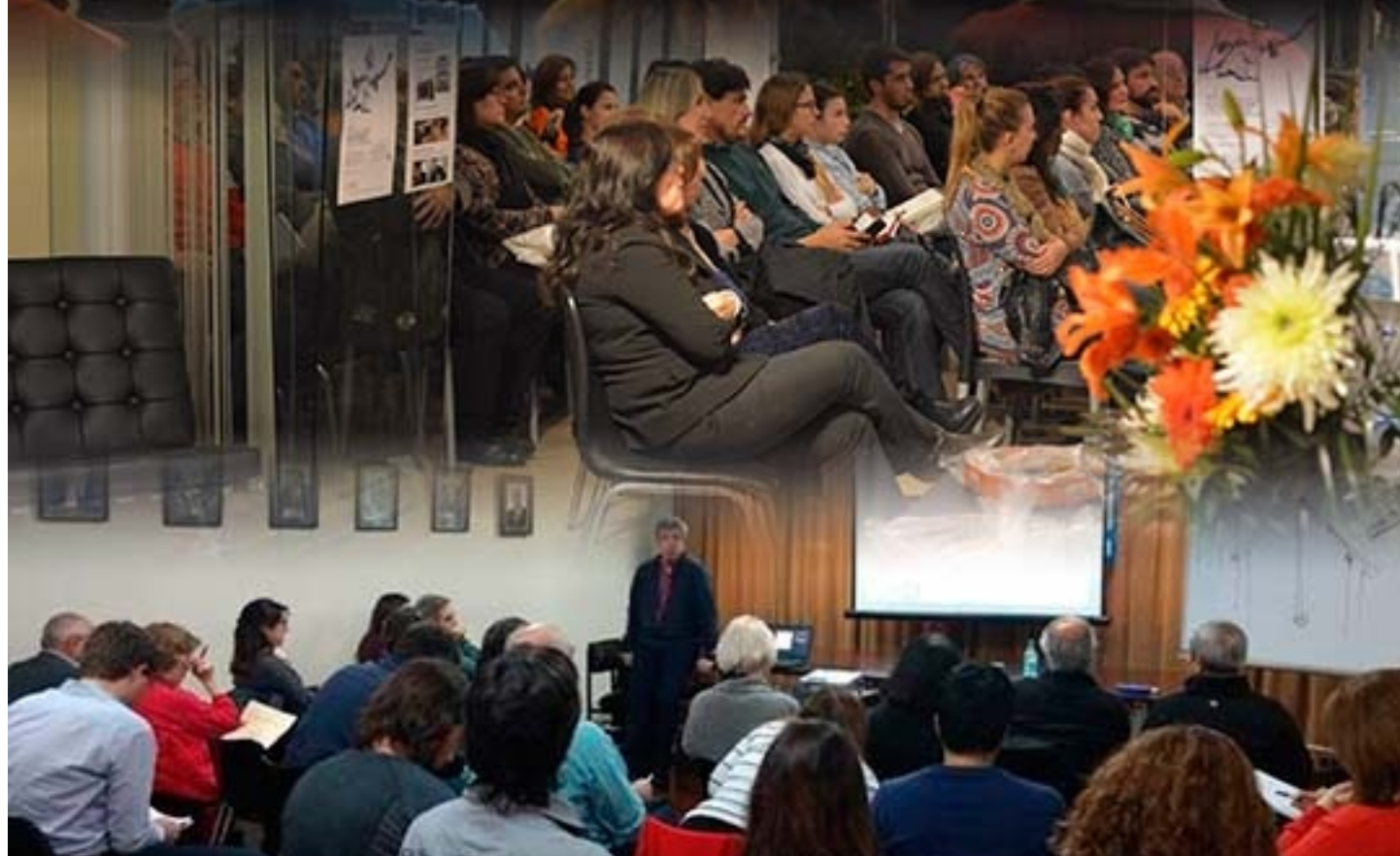
CÁMARA DE LA VIVIENDA Y EQUIPAMIENTO URBANO (CAVERA)