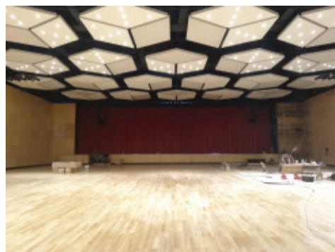
Hangar posterior a la intervención