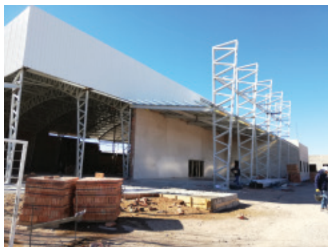
Fachada principal al comienzo de obra