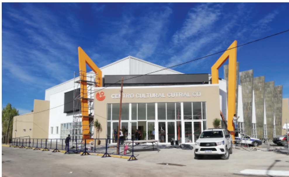
Fachada principal-Vista desde parque de la ciudad