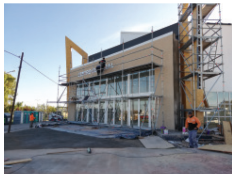
Fachada principal finalizando la obra