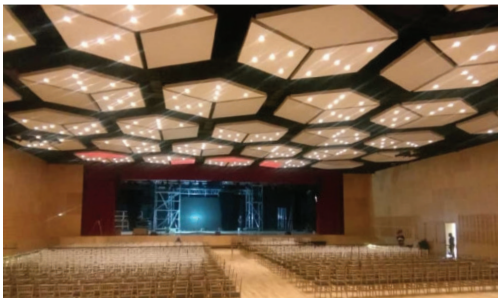
Sala de Usos Múltiples-Intervención hangar