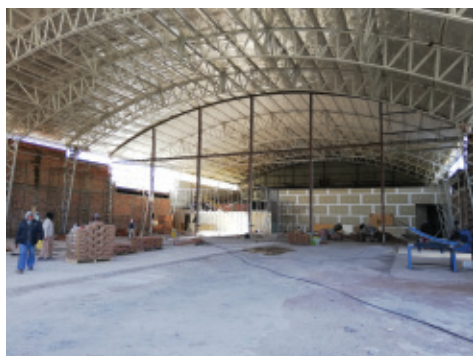
Hangar previo a la intervención